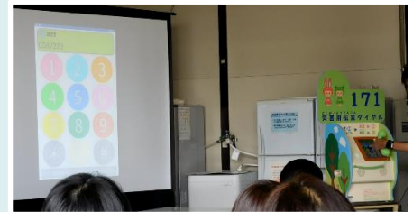
実機とスクリーンを使った講習の様子です