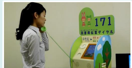
利用イメージです